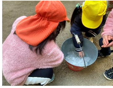
前の日に水をためていたものが次の日の朝、氷になっていました。水に触った後「手、寒い～」と冷たそうにしていました！