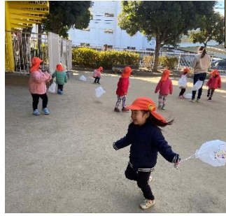
凧にシールを貼り、公園で走って飛ばしました！