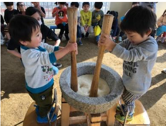
幼児さんのもちつきにぺんぎんも参加しました。おもちをつく前のもち米を試食したり、おもちをつかせてもらいました。家庭ではもちが苦手だった子どもも、園ではペロリと完食していましたよ！