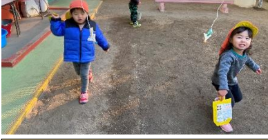
羽根つきでは、羽根に狙いを定めて当てるのが上手です♪

本格的に冷え込み、「外に出たくない」と言い出す子どもたちもいましたが、体を動かして遊んでいる間に暖まり、ジャンパーを脱いでいる姿も見られました！カルタやコマ、凧あげ等の正月遊びや水に触ったり雪がちらつくのを楽しんだり、もちつきも体験しました♪