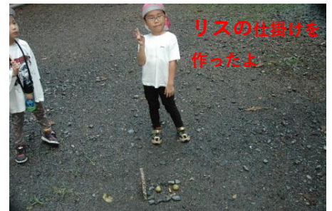
リスの糞掛けを 作ったよ