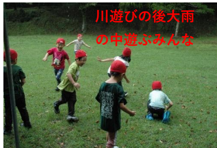
川遊びの後大雨 の中遊ぶみんな