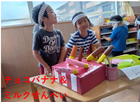
チョコバナナ&ミルクせんべい