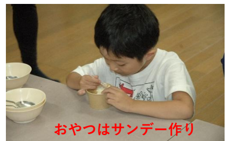
おやつはサンデー作り