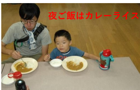
夜ご飯はカレーライス