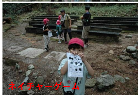
ネイチャーゲーム