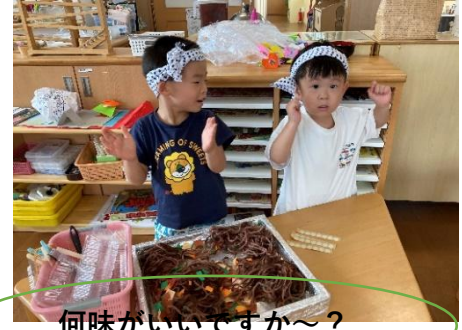
何味がいいですか〜?