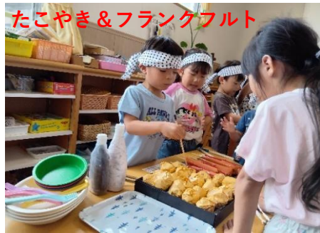
たこやき&フランクフルト