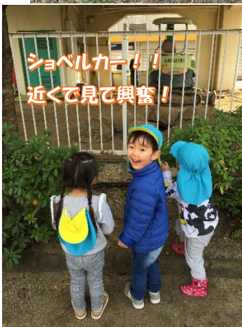
ショベルカー!! 近くで見て興奮!