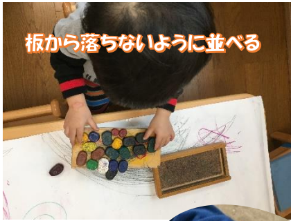
板から落ちないように並べる