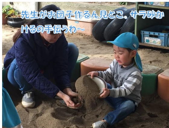
先生がお団子作るん見とこ、サラ砂かけるの手伝うわ～