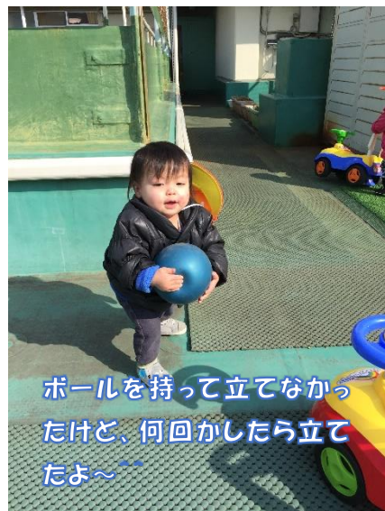
ボールを持って立てなかったけど、何回かしたら立てたよ～