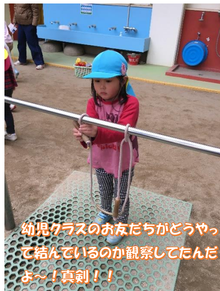
幼児クラスのお友だちがどうやって結んでいるのか観察してんだよ～！真剣！！