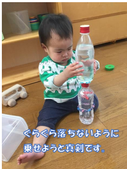
ぐらぐら落ちないように乗せようと真剣です。