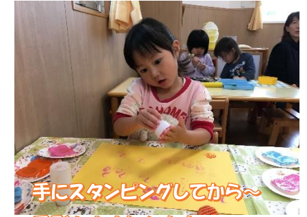
手にスタンピングしてから〜 手形をおすねん！！