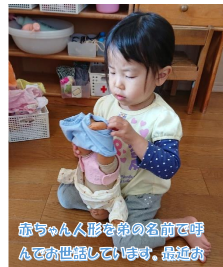
赤ちゃん人形を弟の名前で呼んでお世話しています。最近お姉ちゃんになったのです！