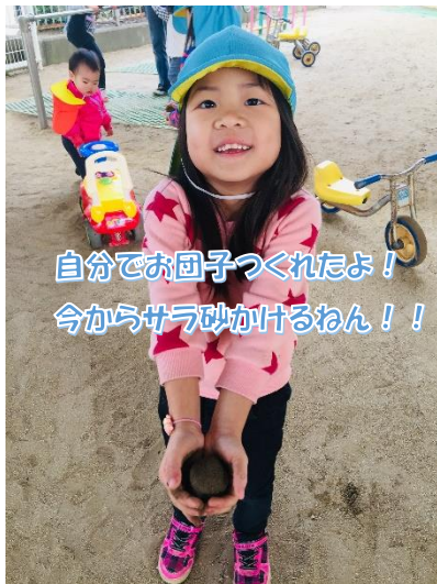
自分でお団子つくれたよ！ 今からサラ砂かけるねん！！