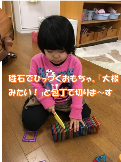
磁石でひっつくおもちゃ。「大根みたい！」と包丁で切りま〜す