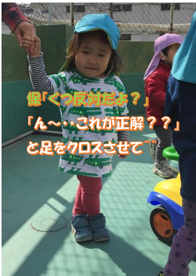
偉「くっ反対だよ？」 「ん〜これが正解？」 と足をクロスさせて