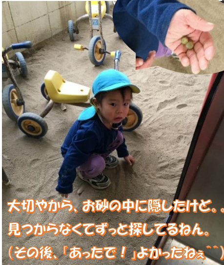
大切やから、お砂の中に隠したけど。見つからなくてずっと探してるねん。(その後、「あったで！」よかったねえ^^)