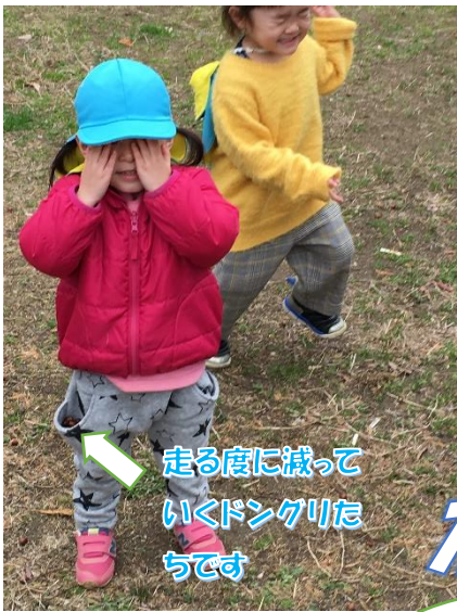
走る度に減って いくドングリた ちです