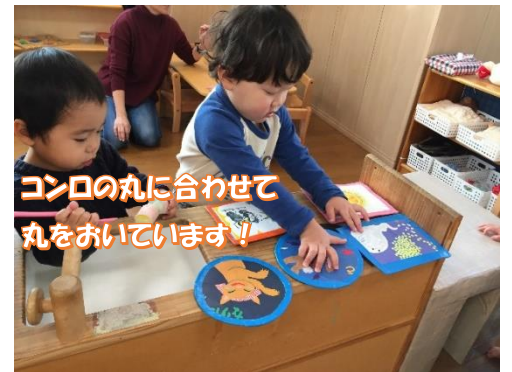
コンロの丸に合わせて丸をおいています！