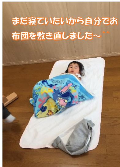
まだ寝ていたいから自分でお布団を敷き直しました〜^^