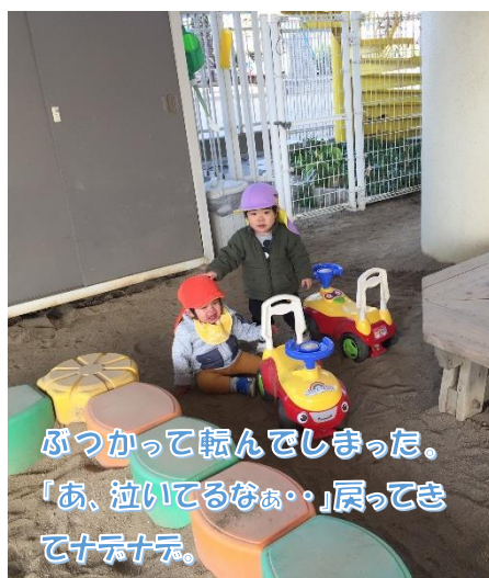
ぶつかって転んでしまった。「あ、泣いてるなあ…」戻ってきて十十十。