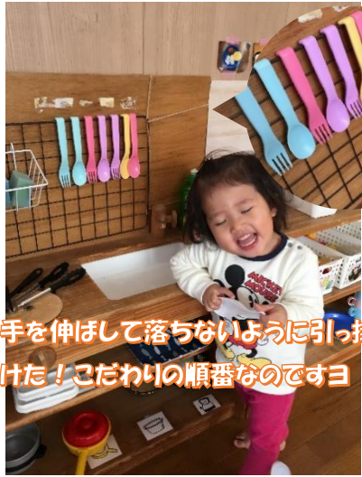
手を伸ばして落ちないように引っ掛けた！こだわりの順番なのですヨ