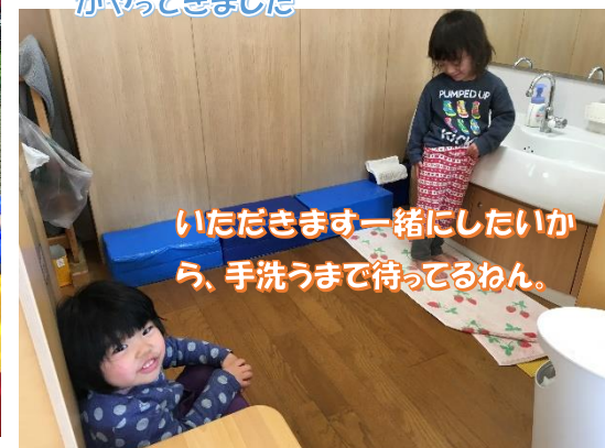
いただきます一緒にしたいから、手洗うまで待ってるねん。