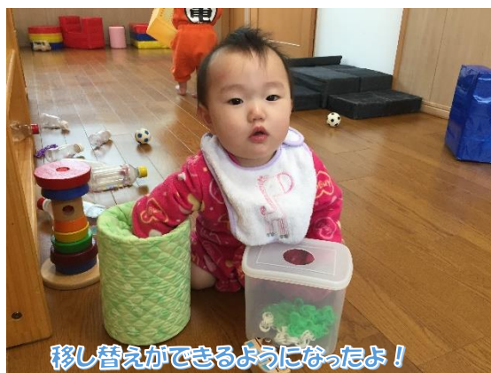
移し替えができるようになったよ！