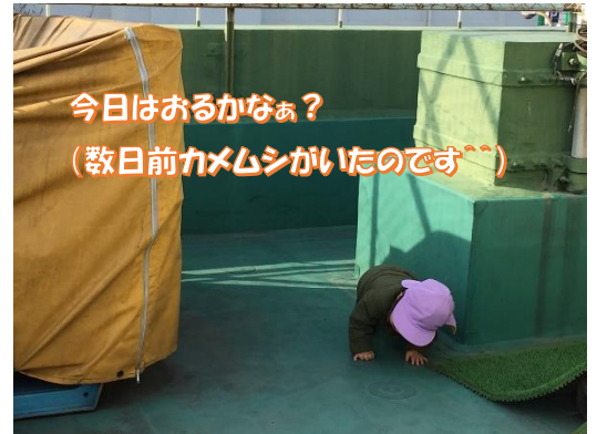
今日はおるかなあ？ (数日前カメムシがいたのです^^)