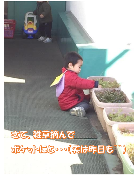
さて、雑草摘んでポケットにと・・・(実は昨日も^^)