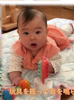
玩具を握って音を鳴らし遊びます！