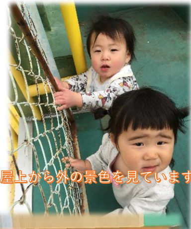
屋上から外の景色を見えています

まだまだ泣く日もあるけれど、いっぱい遊んで、いっぱい食べて、いっぱい笑って、おおきな〜れ！