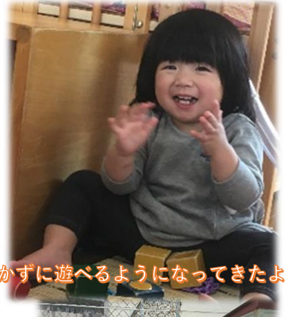
泣かずに遊べるようになってきたよ！