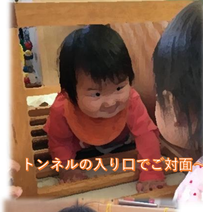
トンネルの入り口でご対面〜！