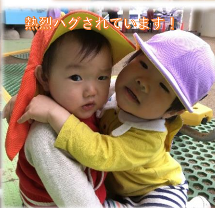
熱烈ハグされています！