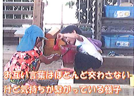
お互い言葉はほとんど交わさないけど気持ちが繋がっている様子