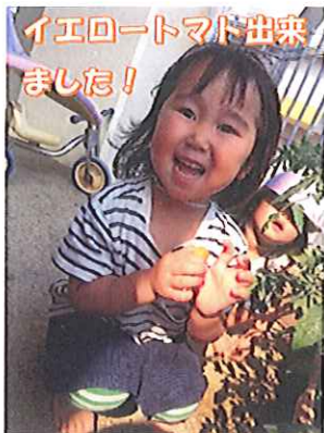
イエローマト出来ました！