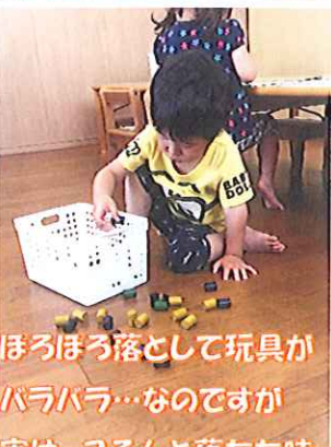
ほろほろ落として玩具がバラバラ…なのですが実は、ころんと落ちた時に立つことがあるのを発見したのです！面白い！