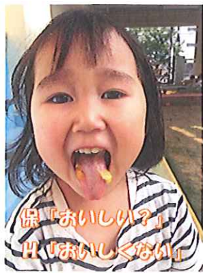
保「おいしい？」 出「おいしくない」