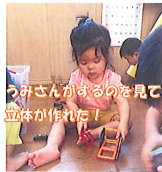
うみさんがするのを見て立体が作れた！