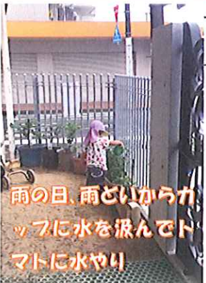
雨の日、雨どいからカップに水を汲んでトマットに水やり