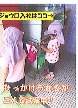
ジョウロ入れはココ→ ひっかけられるか三人で試案中！