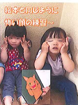
絵本と同じように怖い顔の練習〜