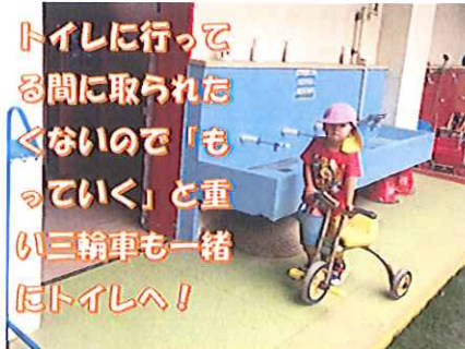
トイレに行っている間に取られたくないので「もっていく」と重い三輪車も一緒にトイレへ！