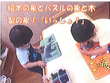
絵本の象とパズルの象と木製の象！「いっしょ！」