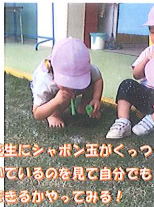
突如にシャボン玉がくっついて見ているのを見て自分でもできるかやってみる！

発想豊かな子どもたち。「面白いこと考えるなあ」と感心してしまいます！そして、お友達への関心が増していて「泣いてるなあ」「今日は来てないなあ」「〇〇ちゃんとあーそぼ！」なんていう言葉もよく聞くようになりました。そんな「ステキ♡」な姿がいっぱいなぺんぎんさんです！