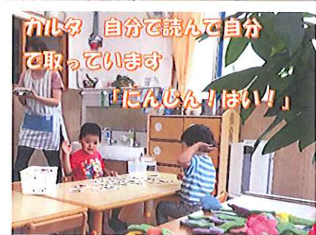
カード 自分で読んで自分で取っています 「じんじん！はい！」