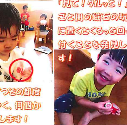
R君は一個ずつその都度通すのではなく、何個かためてから通します!

終わった後、「〇〇ちゃん泣いてたなあ」「〇〇君入らなかつたな」「怖かったな」と友達同士で話しておりました。お友達同士の会話が増えましたね～