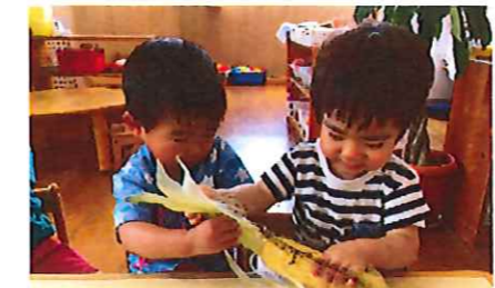
結構、力が必要!二人で引っ張ります!