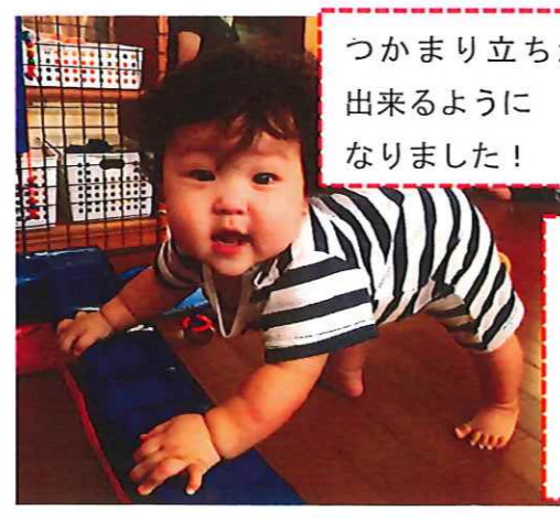
つかまり立ちが出来るようになりました!