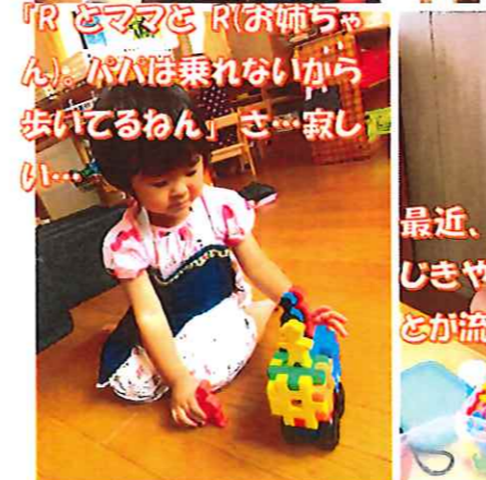
「RとママとR(お姉ちゃん)が入り乗れないから歩いてるわん」さ...寂しい...