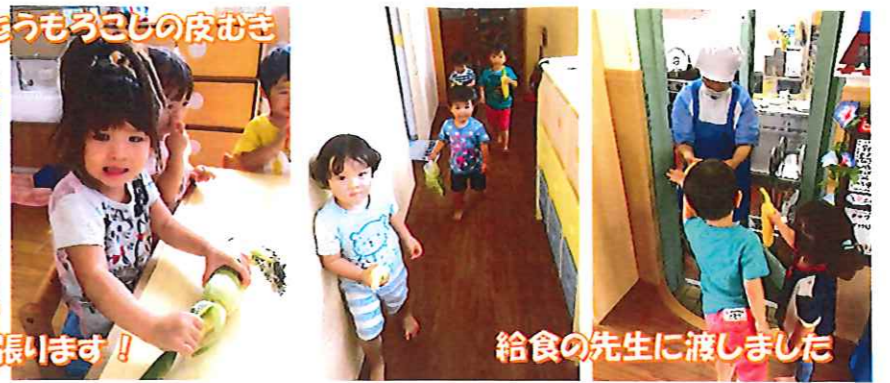
給食の先生に渡しました