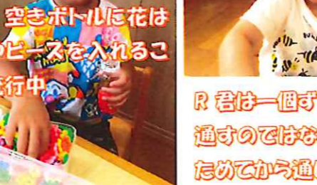
最近、空きボトルに花はじきやビーズを入れることが流行中