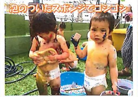
泡のついたスポンジでゴシゴシ