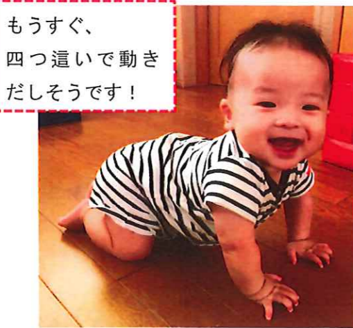
もうすぐ、四つ這いで動きだしそうです!

子どもの遊ぶ様子が少しずつ変化してきました。お友達の名前を言ったり、一緒に遊ぼうとしたり、お互い意識して模倣し合う姿が多くなってきました。仲間意識が育ってきたみたいです。年度後半、そんな姿がますます増えていくのでしょうね!