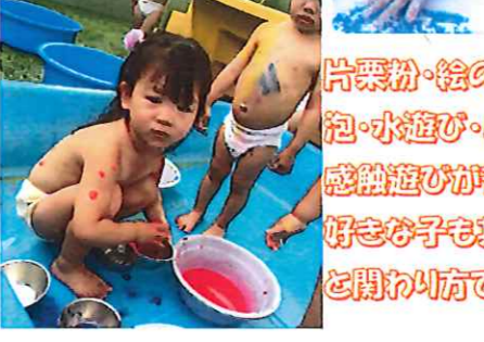
片栗粉・絵の具・色水 泡・水遊び・小麦粉粘土 感触遊びが苦手な子も好きな子も其々のペースと開わり方で遊びました