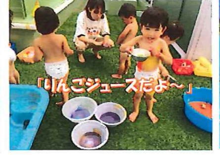
「りんごジュースだよ～」