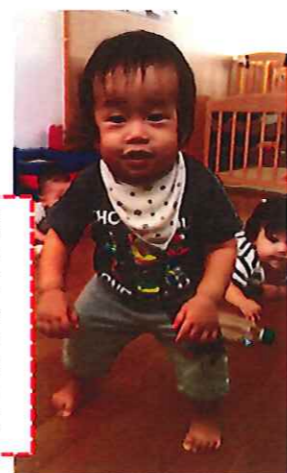
立ち上れるようになりました!