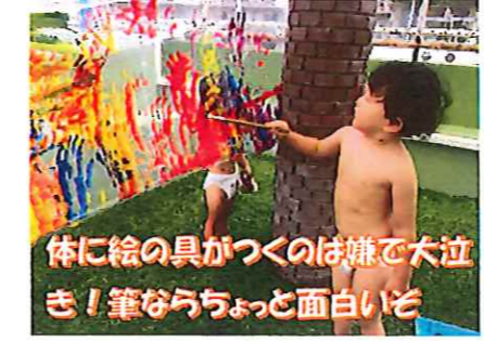
体に絵の具がつくのは嫌で大泣き!筆ならちよっと面白いぞ