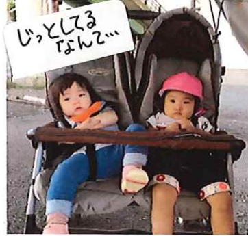
じっとしてる なんて...