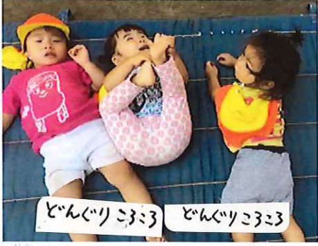
どんぐりころころ

さわやかな風を感じる季節となりました。園庭では運動遊びを楽しむ子ども達の姿が見られます。始めはできなかつたことも、何回もする中でできるようになってくると「やったー!」と嬉しい笑顔の子どもたちです。今月は、お散歩にも出かけて行き、いっぱい秋を感じたいです!