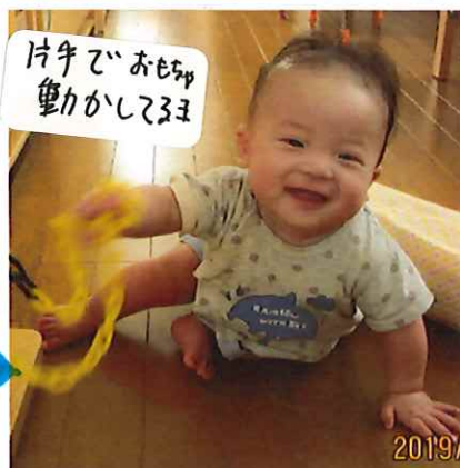
片手でおもちゃ 動かしています