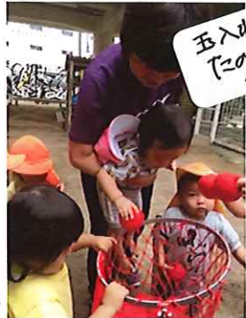
玉入れ たのしいー? やったー!