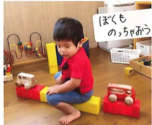
ほくも のちやあうと