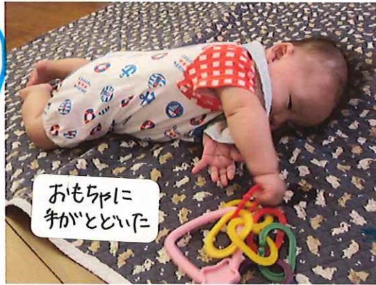
おもちゃに 手がとどいた