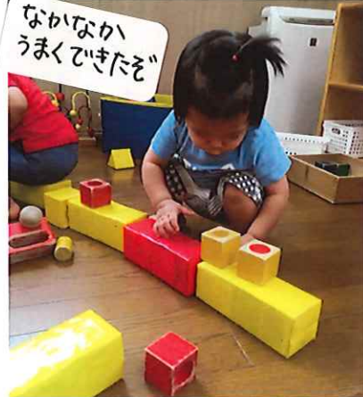
なかなか うまくできたぞ