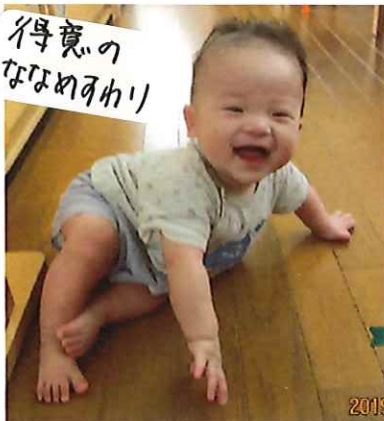
得意の ななめ座り