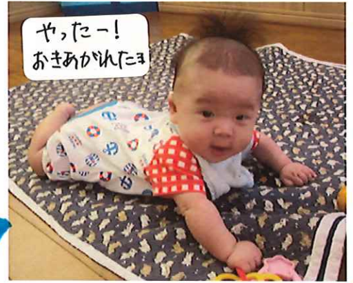
やったー! おきあがれたヨ