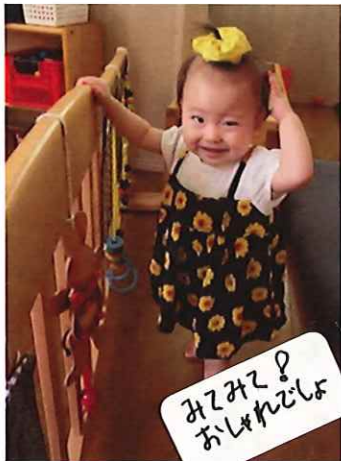
みぞみぞ? おしれどしよ