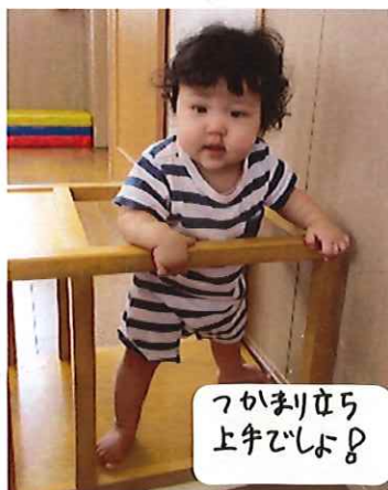
つかまり立ち 上手でしょ?

室内では積木を積んだり並べたりお絵かきしたり、トイレットペーパーを転がした時は大はしゃぎの子ども達でした。自分なりに考えてじっくり遊ぶ姿も個々に見られるようになってきています。 一人ひとりの興味を見つけてながら一緒に楽しめるように関わっていきたいと思います。