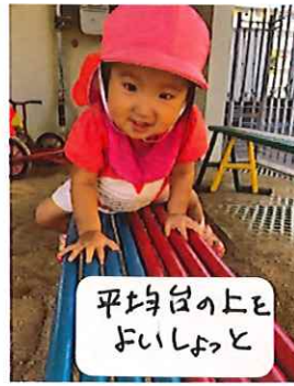
平均台の上と よいしょと