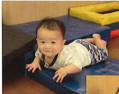
こんな所にも 行けるようにな りました!