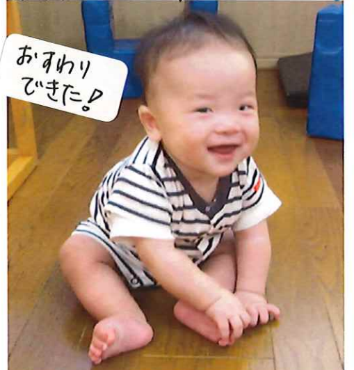
おすわり できました!