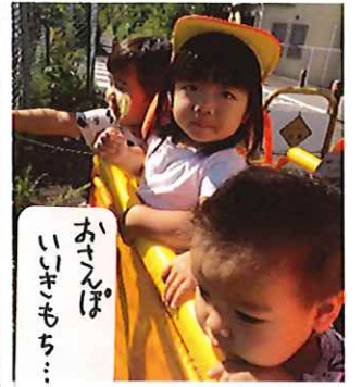
おせんぼ いきもち...