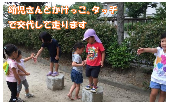
幼児さんとかけっこ、タッチで交代して走ります