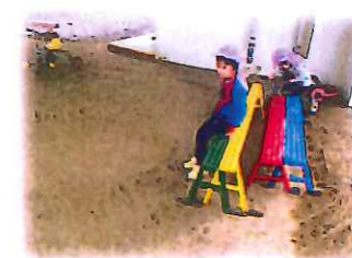
お姉ちゃんも休憩...

砂の上で倒れた三輪車を → 続けて2回目も、砂の上でデコボコしていて倒れやすいと思ったので「しょうか?」それで、平らな所へ移動させてあげたのかもしれないね!