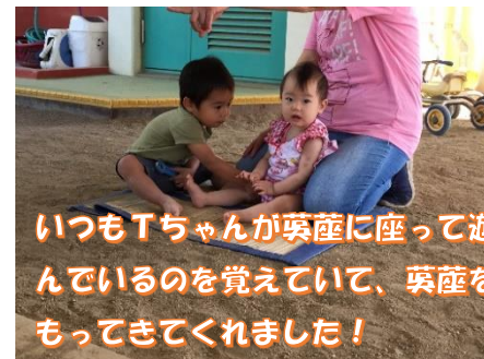
いつもTちゃんが葵産に座って遊んでいるのを覚えていて、葵産をもってきてくれました！