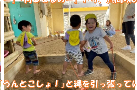
「うんとこしょ！」と縄を引っ張っています

芋ほりの後、行く前よりも芋の絵本をよく見ていたり、「うんとこしょ、どっこいしょ」と芋ほりごっこをしたり、給食の芋や野菜に興味を持ったり、経験したことで興味が一段と湧いた様子です。お家でも料理してもらい、自慢気にお家の方と食べたというお話をたくさん聞きました。経験の大切さを改めて感じました。