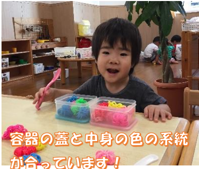
容器の蓋と中身の色の系統 が合っています！

お部屋でもお庭でも、お店屋さんごっこをする姿が多くなりました。「○○くださーい」「はーい。ちょっとおまちくださーい」とやり取りしています！また、女の子達は「○○ごっこ」が盛んに！フリキュア、赤ちゃん、お母さん、お姉ちゃんの役を決めてなまっています！