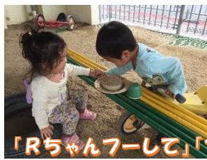
「Rちゃんフーして」「フー！あはは！Dくんフーして」「フー！あはは！」フーっと吹くと砂がフフーっと舞っていくのを楽しんでいます