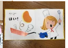
絵本を真似して フライパンで 焼いっ!

お部屋でもお庭でも、お店屋さんごっこをする姿が多くなりました。「○○くださーい」「はーい。ちょっとおまちくださーい」とやり取りしています！また、女の子達は「○○ごっこ」が盛んに！フリキュア、赤ちゃん、お母さん、お姉ちゃんの役を決めてなまっています！