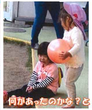
何かあったのかな？と 見つめるRちゃん…