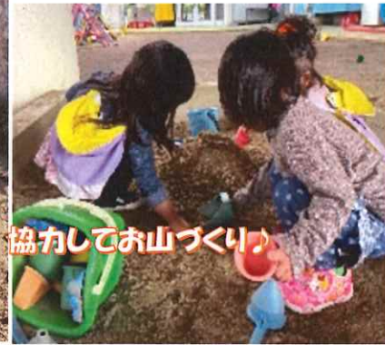
協力してお山づくり♪