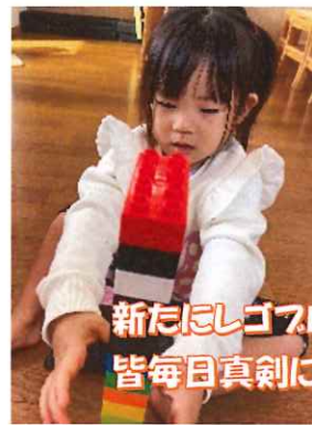
新たにレゴブロックを出しました！ 皆毎日真剣に作っています♪