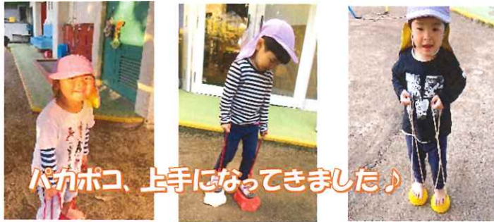
パカポコ、上手になってきました♪

寒くなってきましたが、元気に遊ぶぺんぎんさん。友達が泣いていると自然と駆け寄る姿も出てきました♪ またパカポコや縄跳び、レゴブロックなど、色んなものに挑戦しています！！