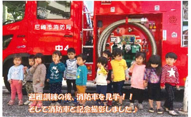
避難訓練の後、消防車を見学！！ そして消防車と記念撮影しました♪