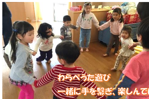
わらべうた遊び 一緒に手を繋ぎ、楽しんでいます♪

朝の準備や帰りの用意、うがいにも慣れてきました♪ 二月末から幼児さんと過ごし始めました！ わらべうたや運動遊び、散歩など、少しずつ慣れていきたいと思います♪