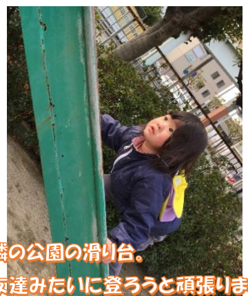
隣の公園の滑り台。 友達みたいに登ろうと頑張ります