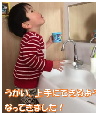
うがい、上手にできるよう なってきました！