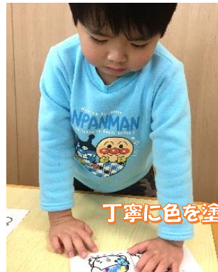
丁寧に色を塗っています！