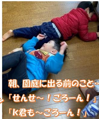
朝、園庭に出る前のこと… 「せんせ〜！ごろうん！」 「K君も〜ごろうん！」