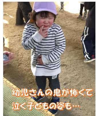
幼児さんの鬼が怖くて泣く子どもの姿も…