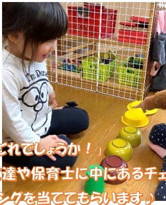
「どれでしょうか！」 友達や保育士に中にあるチェーン リングを当ててもらいます♪