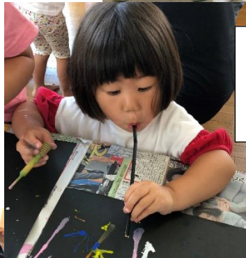
盆踊りで使う、 うちわを作りました！ 素敵なうちわができたね☆