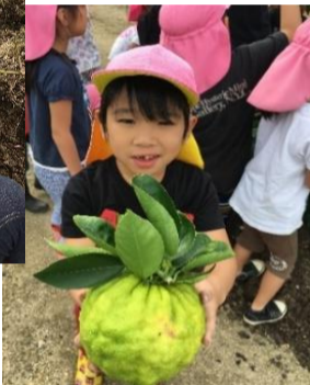
両手いっぱいの大収穫です。