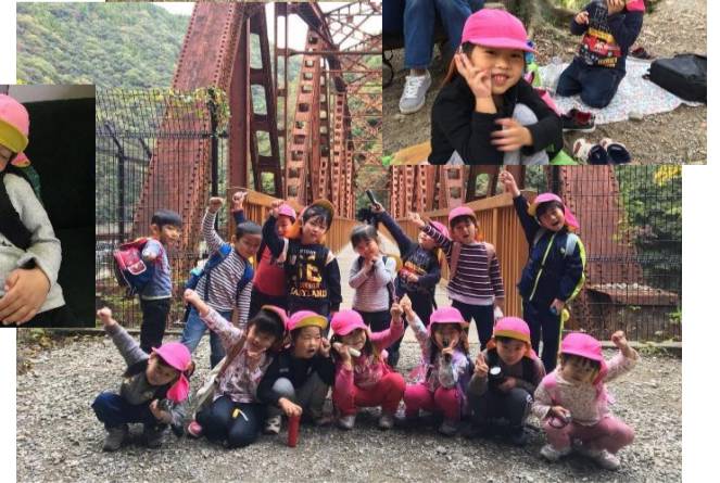
武田尾廃線ハイク 2018 10. 31