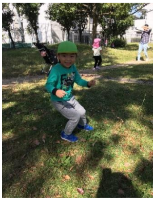
芝生公園は走るのに一番！