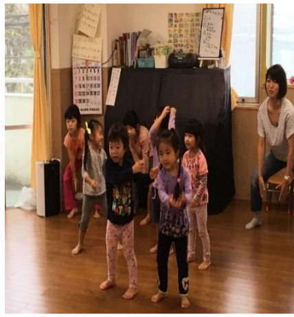
運動会のあとみんなでボール、よっちょれ、ソーランを楽しみました。