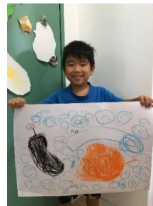
祭り行った。かき氷🍧コーラ味 だった。ウイナーあった。 ゲーム100円だった。大当たりだった。