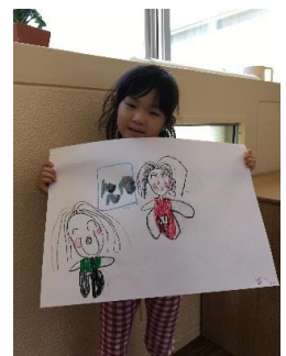
ママと須磨水族園に行ったよ。 ゆいなのは前に行ってお魚見たよ。 ひまわりのワンピースを着て行った。 また行きたい。