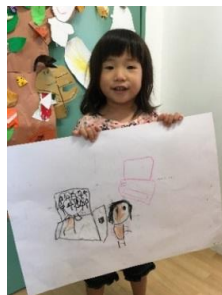
ばあばが遊びに来た。 シール貼って、お絵かきした。 ワンカルビ行った。 たのしかった。