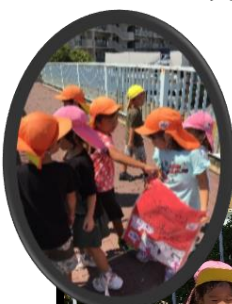
秋祭りのポスター 完成しました🎉