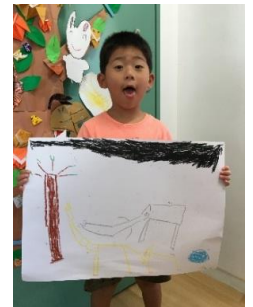
ママとりゅうごとはあちゃんと 動物園に行った。北極ぐまの お魚食べているとこみた。