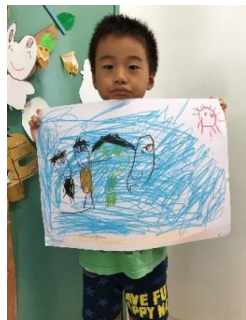
昨日川で遊んだ。着いたら水着 着替えて ちっちゃい カニおった。 水 冷たかった🐚 スリッパ脱げた。