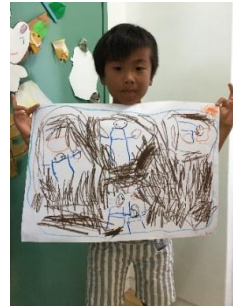
Ⓢ野球の試合で勝った。 8-1だった。ホームラン打った。 気持ち良かった～😊